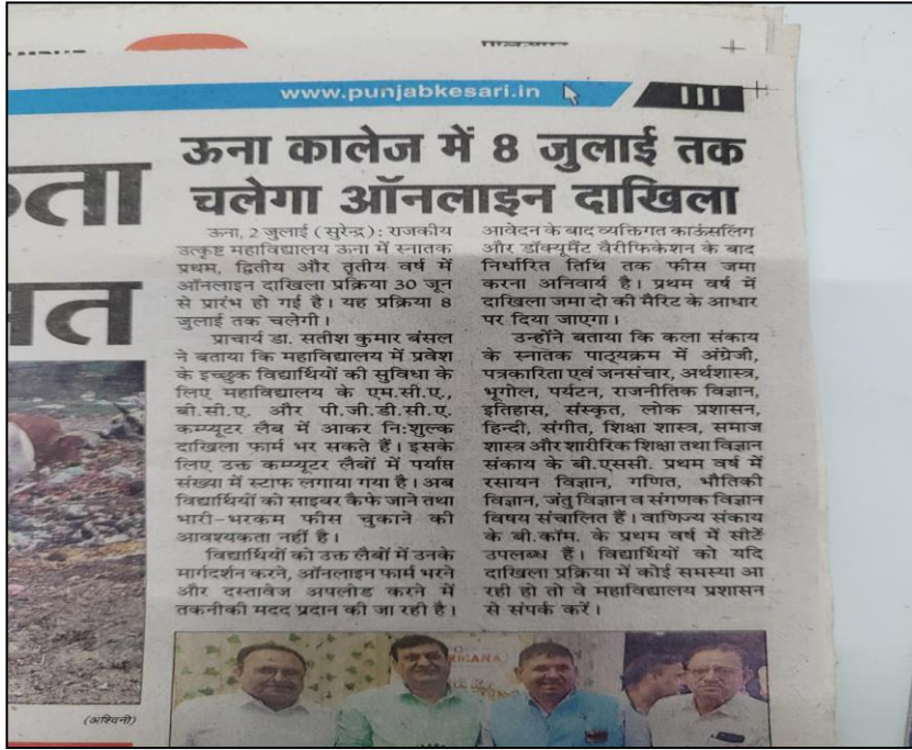
( 2.1.i Publicity through newspaper)