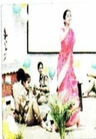
कार्यक्रम के दौरान प्रस्तुति देते हैं।