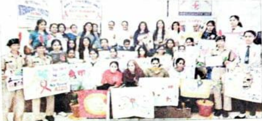
प्रतिभागी छात्र-छात्रों के साथ मुख्यालय व अन्य के साथ सांस्कृतिक प्रदर्शन। सतलुज।

राजकीय उल्फूट महाविद्यालय ऊना के महिला सेल ने रेड रिबन क्लब और रेडक्रास क्लब के संयुक्त सहयोग में स्वास्थ्य-स्वच्छता पर जागरूक करने के लिए नुककड़ नाटक, पोस्टर मेकिंग, नारा लेखन, कविता पाठ प्रतियोगिता का आयोजन किया गया।